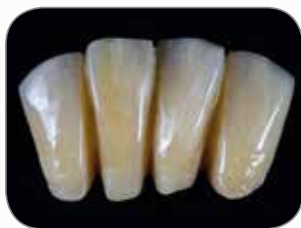
Lavoro realizzato dall'odontotecnico Philippe Llobell, Francia