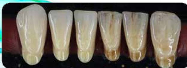
Lavoro realizzato dall'odontotecnico Jean François Deche, Francia