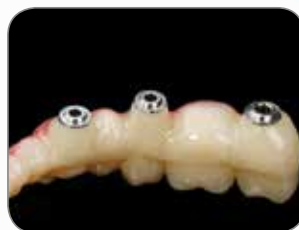
Lavoro realizzato dall'odontotecnico Christian Rothe, Germania