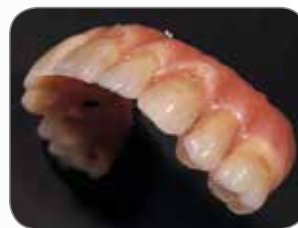
Lavoro realizzato dall'odontotecnico Roeland De Paepe, Belgio